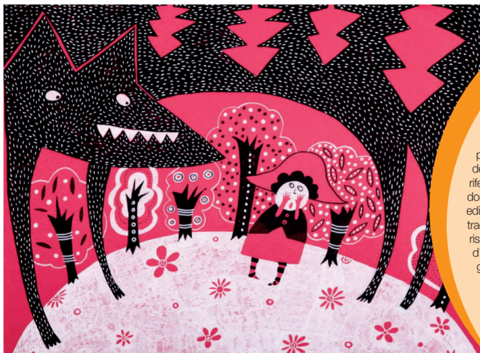
BOLOGNA. Un'illustrazione della russa Sofia Venzel